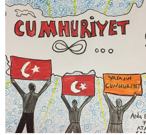
Arda Ege Onat 7-B