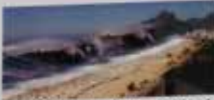
North Pacific Coast, Japan - 11 March 2011

A tsunami wave can travel 800km per hour with